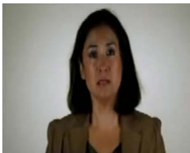
Mujer 1: Tengo unas preguntas para ti Cienfuegos

a) Técnica. El promovente anexó a su escrito de queja un disco compacto que contiene un archivo de video denominado “ROBLEDO”, mismo que al reproducirlo se advierte lo siguiente: