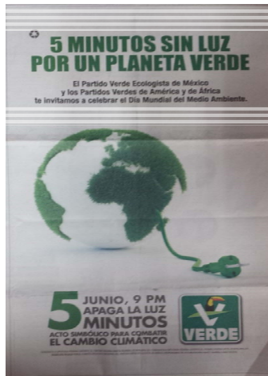
Desplegado inserto en el periódico Reforma el martes dos de junio.