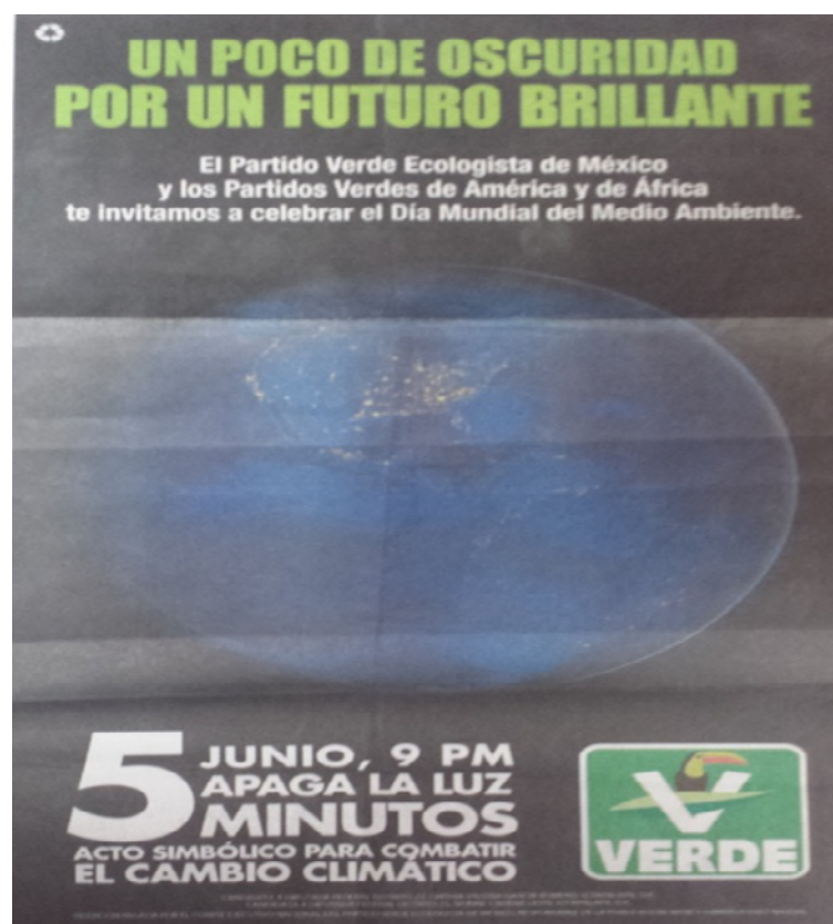
Desplegado inserto en el periódico Reforma el miércoles tres de junio.