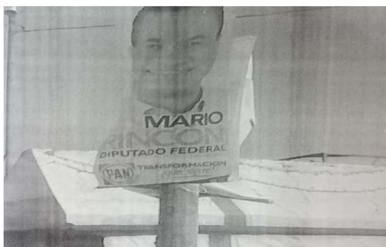
Pendón tipo 2

En el caso de los pendones tipo uno (1), el acta circunstanciada en cuestión, indica, tienen las siguientes características: