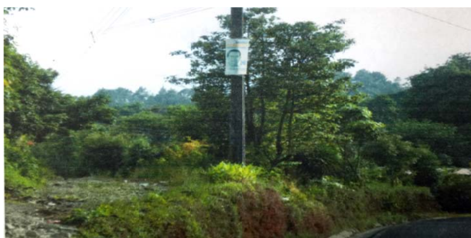
Propaganda del candidato y el PAN

Técnicas. Consistentes en tres fotografías aportadas por el Promovente de la propaganda electoral denunciada: