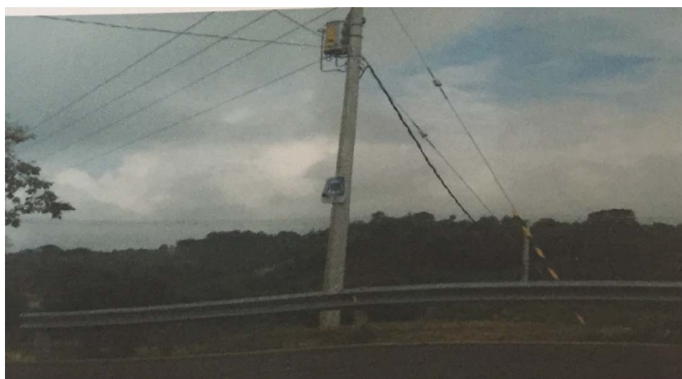
Propaganda genérica del PAN