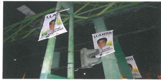
Puente peatonal ubicado en Eje 10 sur, Pedro Enríquez Ureña esquina con calle Las Flores, Pueblo Los Reyes, Código Postal 04330, México Distrito Federal.