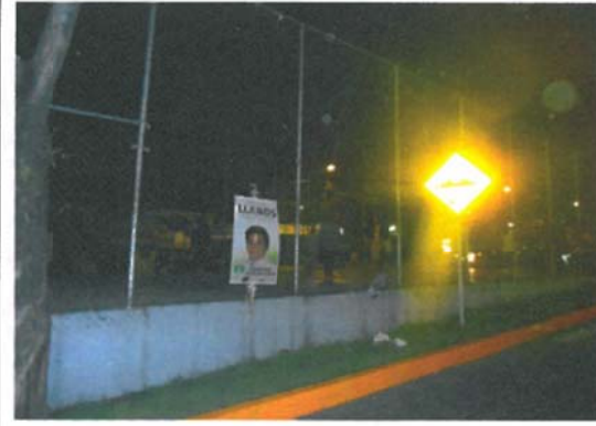
Eje 10 sur, Pedro Enríquez Ureña, entre calle Las Flores y calle Profa Aurora Reza, Pueblo Los Reyes, Código Postal 04330, México Distrito Federal.