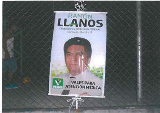
Eje 10 sur, Pedro Enríquez Ureña, entre calle Las Flores y calle Profa Aurora Reza, Pueblo Los Reyes, Código Postal 04330, México Distrito Federal.