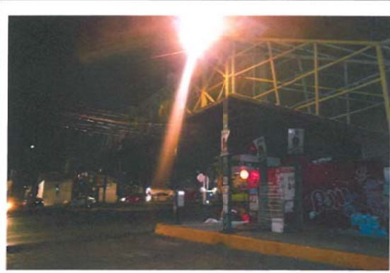
Eje 10 sur, Pedro Enríquez Ureña esquina con calle Las Flores, Pueblo Los Reyes, Código Postal 04330, México Distrito Federal.