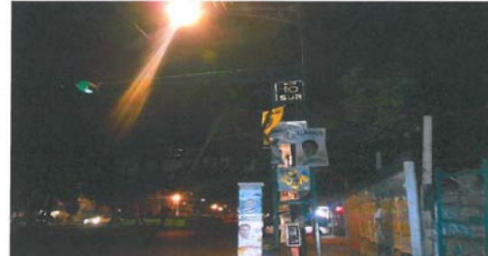
Eje 10 sur, Pedro Enríquez Ureña y calle Las Flores, Pueblo Los Reyes, Código Postal 04330, México Distrito Federal.