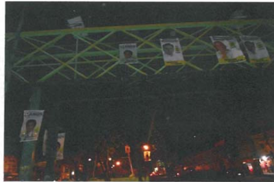
Eje 10 sur, Pedro Enríquez Ureña esquina con calle Las Flores, Pueblo Los Reyes, Código Postal 04330, México Distrito Federal.