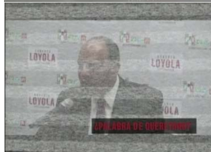
Esto no es palabra de queretano.