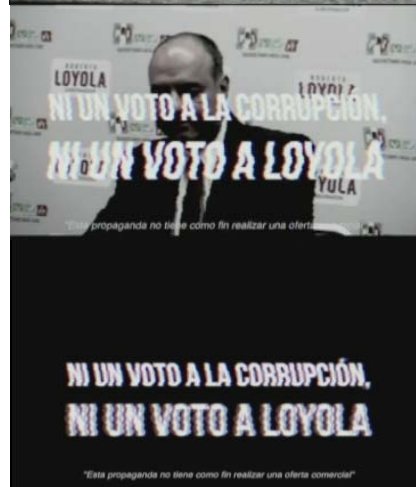
Es la típica del PRI.