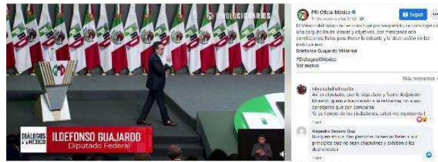
El México del futuro no se construye por un partido, se construye por una conjunción de ideales y objetivos, por mexicanos con convicciones, listos para frenar la debacle...

El México del futuro no se construye por un partido, se construye por una conjunción de ideales y objetivos, por mexicanos con convicciones, listos para frenar la debacle y la destrucción de las instituciones.