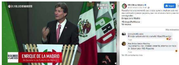
Necesitamos una economía que crezca, genere empleos cada vez más calificados y mejor pagados, que nos alcance a todos para vivir con dignidad. Enrique de la...

Necesitamos una economía que crezca, genere empleos cada vez más calificados y mejor pagados, que nos alcance a todos para vivir con dignidad.