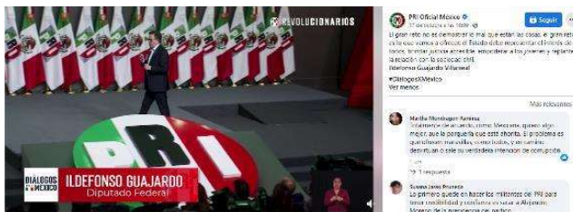
El gran reto no es demostrar lo mal que están las cosas, el gran reto es lo que vamos a ofrecer: el Estado debe representar el interés de todos, brindar justicia accesible...

El gran reto no es demostrar lo mal que están las cosas, el gran reto es lo que vamos a ofrecer: el Estado debe representar el interés de todos, brindar justicia accesible, empoderar a los jóvenes y replantear la relación con la sociedad civil.