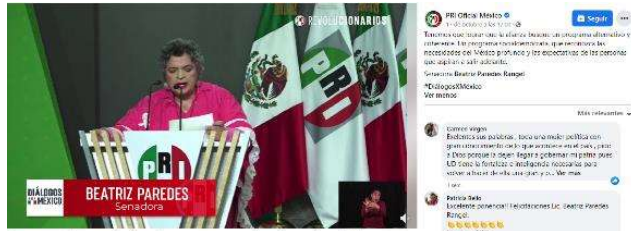
Tenemos que lograr que la alianza busque un programa alternativo y coherente. Un programa socialdemócrata, que reconozca las necesidades del México profundo y...

Tenemos que lograr que la alianza busque un programa alternativo y coherente. Un programa socialdemócrata, que reconozca las necesidades del México profundo y las expectativas de las personas que aspiran a salir adelante.