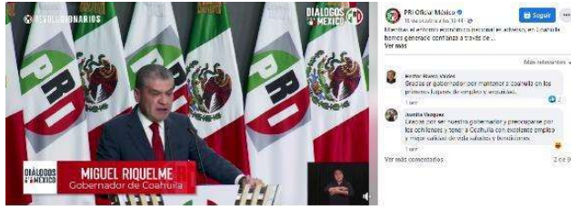
Mientras el entorno económico nacional es adverso, en Coahuila hemos generado confianza a través de un nuevo pacto laboral, basado en la coordinación entre...

Mientras el entorno económico nacional es adverso, en Coahuila hemos generado confianza a través de un nuevo pacto laboral, basado en la coordinación entre gobierno, empresarios y sindicatos. ¡Un atractivo para la generación de empleo!