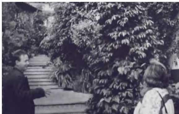
El secretario administrativo mostrándome las instalaciones de la Sala Regional Xalapa.

A principios de noviembre de 1997, me trasladé a Xalapa, Veracruz, con profunda tristeza, porque ninguno de mis dos hijos se pudo ir conmigo.