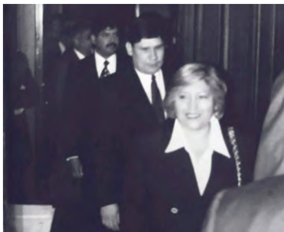
Toma de protesta en el Senado de la República.

También en el Senado de la República, en sesión del Pleno, rendimos protesta los magistrados electorales del PJF. Así inició esa historia de vida que tanto marcaría el destino del país y el mío.