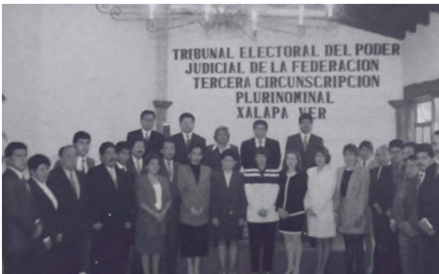
Personal que conformó la primera integración de la Sala Regional Xalapa.

Para elegir a los abogados que colaborarían conmigo, me basé en las recomendaciones que me hicieron mis compañeros magistrados, sobre todo, en las del presidente de la Sala, a quien elegimos en cuanto nos entregaron los nombramientos.