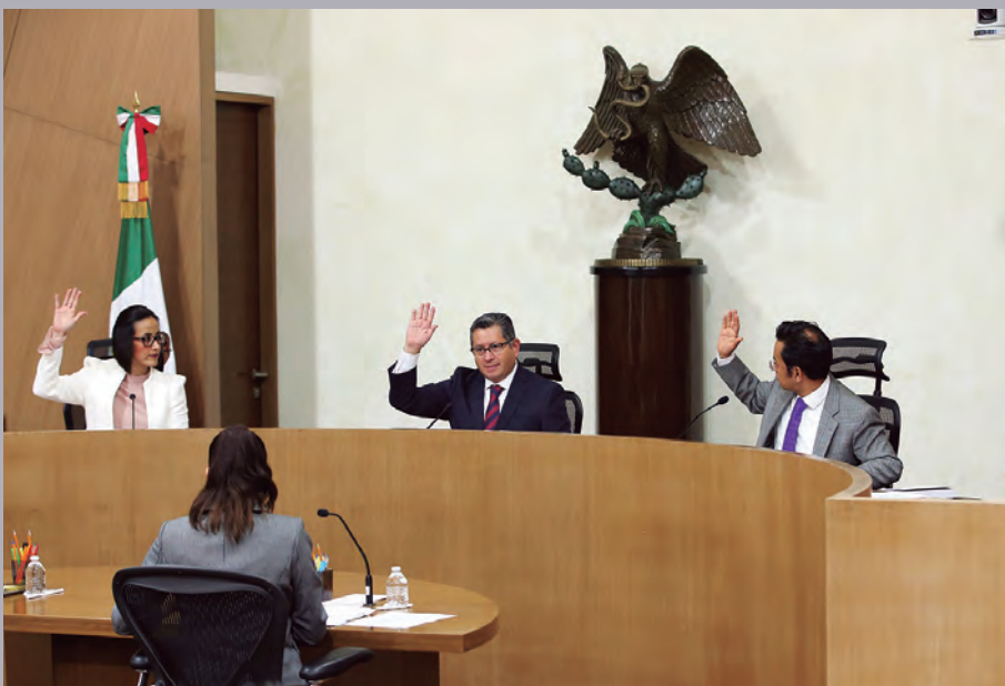
Sala Ciudad de México