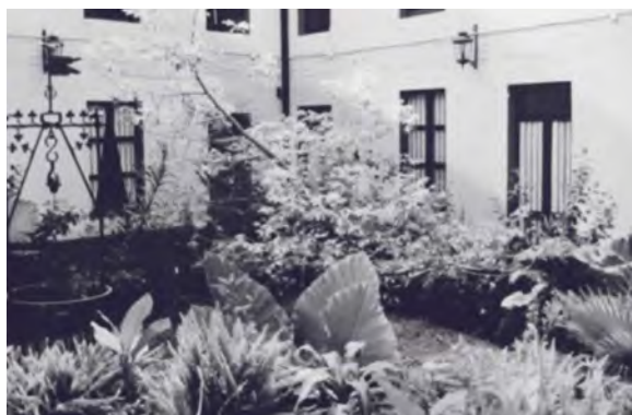
Primera sede de la Sala Regional Xalapa.

Dejé todo para ir a desempeñar mi cargo de magistrada de la Sala Regional Xalapa. Me instalé en un departamento amueblado que estaba en el fondo de la calle Úrsulo Galván, en el centro, donde también estaba la Sala de la cuarta circunscripción territorial, con sede en Xalapa, Veracruz.