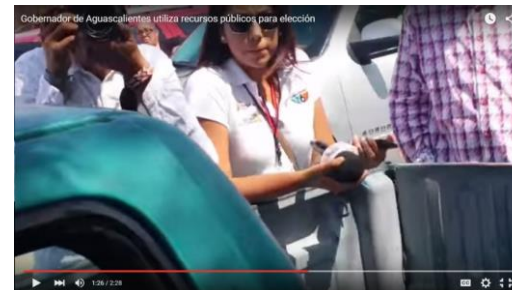
Personal del canal de televisión del gobierno del estado "Aguascalientes TV"