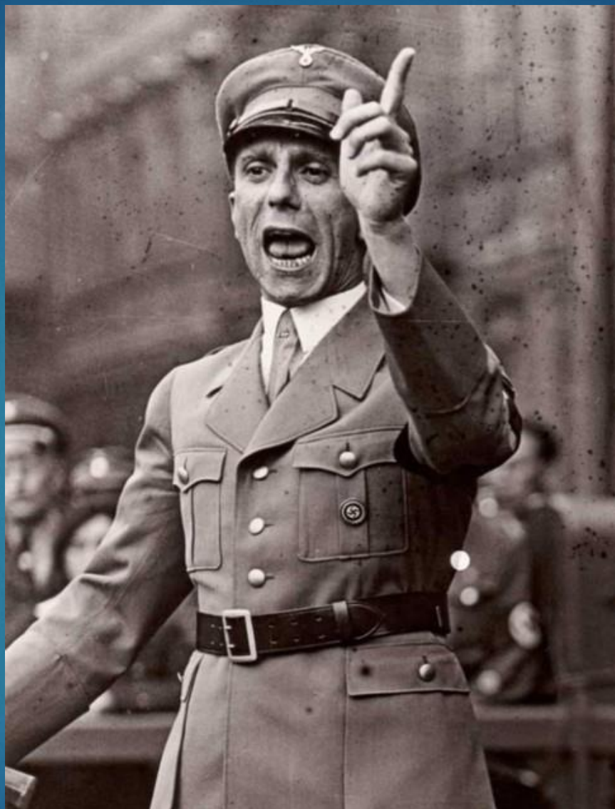
Joseph Goebbels Padre de la propaganda política moderna