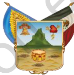
Estado Libre y Soberano de Hidalgo