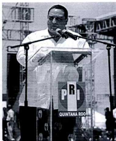
Roberto Borge Angulo rindió protesta como candidato del PRI a la gubernatura del estado.

"Desde aquí le digo a nuestros adversarios, que podrán hacer las triquiñuelas que quieran, podrán espionarnos, podrán hasta utilizar recursos de dudosa procedencia, pero jamás podrán con nuestro partido", precisó.