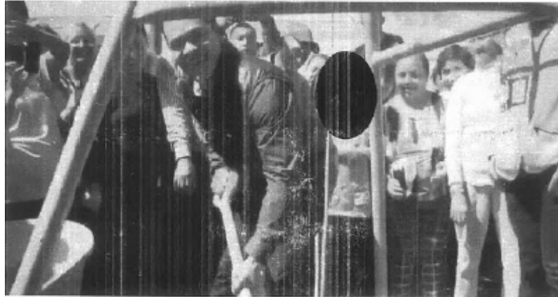
[La parte oculta contiene imagen de presunto menor de edad]