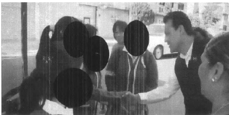
[La parte oculta contiene imagen de presuntos menores de edad]