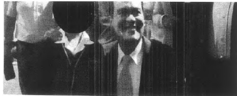
[La parte oculta contiene imagen de presunto menor de edad]