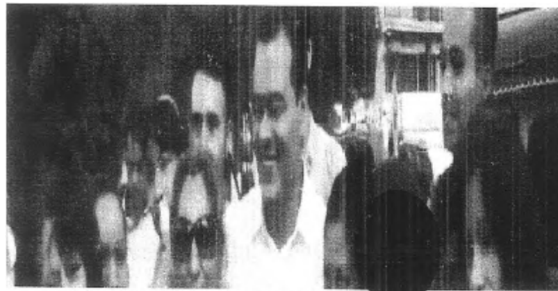
[La parte oculta contiene imagen de presuntos menores de edad]