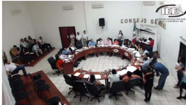
Sesión Extraordinaria del Consejo General del IEEBCS, de fecha 30 de Marzo de 2015 Parte