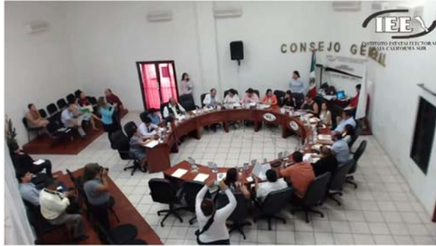
Sesión Extraordinaria del Consejo General del IEEBCS, de fecha 30 de Marzo de 2015 Parte