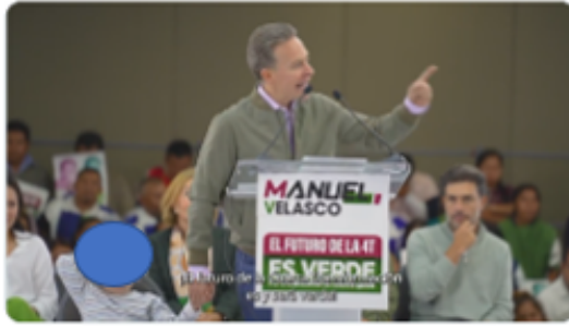
8:51 PM · Aug 27, 2023 · 1,400 Views