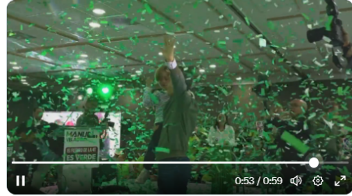
9:51 PM · Aug 27, 2023 · 2,962 Views