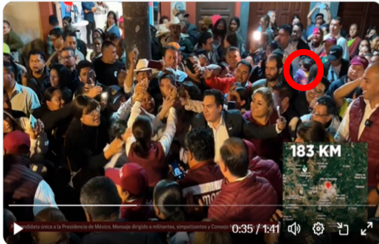
Imagen representativa ampliada de la escena 11 del video de la publicación