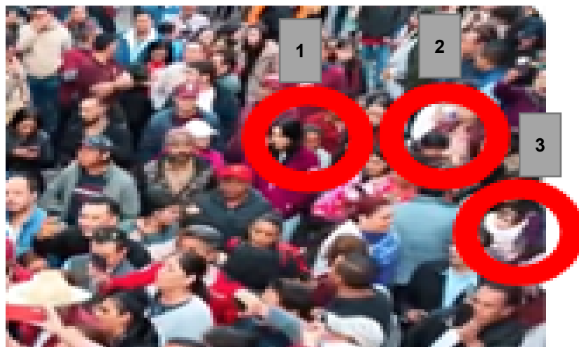
Imagen representativa ampliada de la escena 21 del video de la publicación

Además, cabe precisar que las personas señaladas con los numerales 1 y 2 tampoco pueden identificarse si se trata de una niña y un niño o bien adolescentes, ya que la primera se encuentra detrás de una persona y no se logra advertir con claridad, mientras que el segundo se ubica de espaldas a la toma del video.