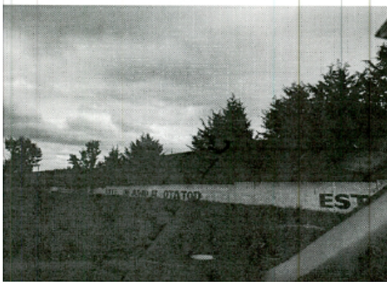
Foto 1. Borda blanco derecho Plantel Otilio Montañó Tiabari 2 (Tapilejo) del Instituto de Educación Media Superior de la Ciudad de México.