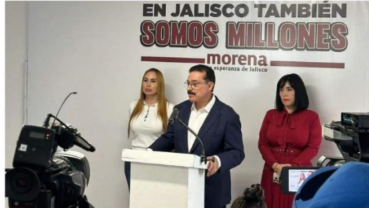
El legislador morenista recordó que desde el Congreso se dio el primer paso y se aprobó la reforma judicial.

El tribunal de disciplina judicial será el órgano responsable de vigilar, evaluar y sancionar a jueces y magistrados que no cumplan con su deber, explicó