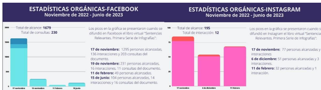
Imagen 2. Estadísticas Orgánicas. Facebook e Instagram