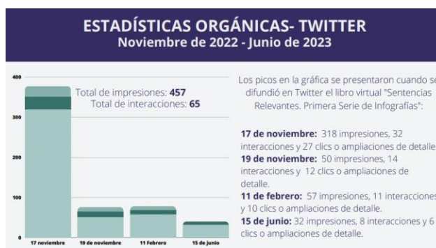
Imagen 3. Estadísticas Orgánicas. Twitter.