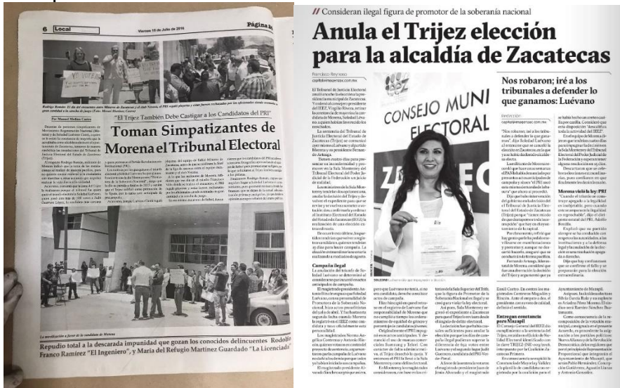
Fuente: Nota publicada en el periódico “Página 24” el 15 de julio de 2016 y nota publicada en el periódico “Imagen” el 6 de julio de 2016.

Asimismo, de la lectura de las referidas notas periodísticas se observa que en ninguna se retoman los elementos centrales establecidos en la sentencia que permitieran otorgarle a la ciudadanía un punto de vista justificado de la decisión, situación que pudo causar desinformación entre la sociedad.