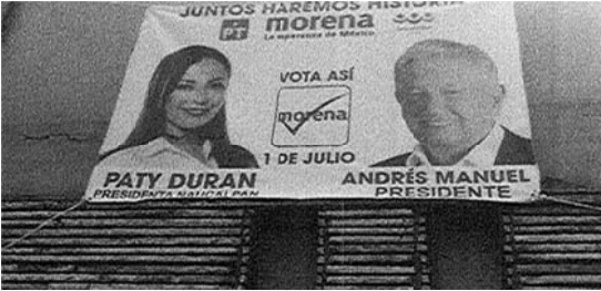
Imagen de la demanda