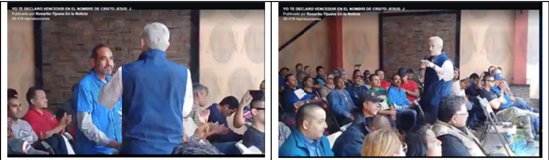
Jorge Ramos: "Ten confianza, de que esa persona que vive en ti va a aflorar y va a